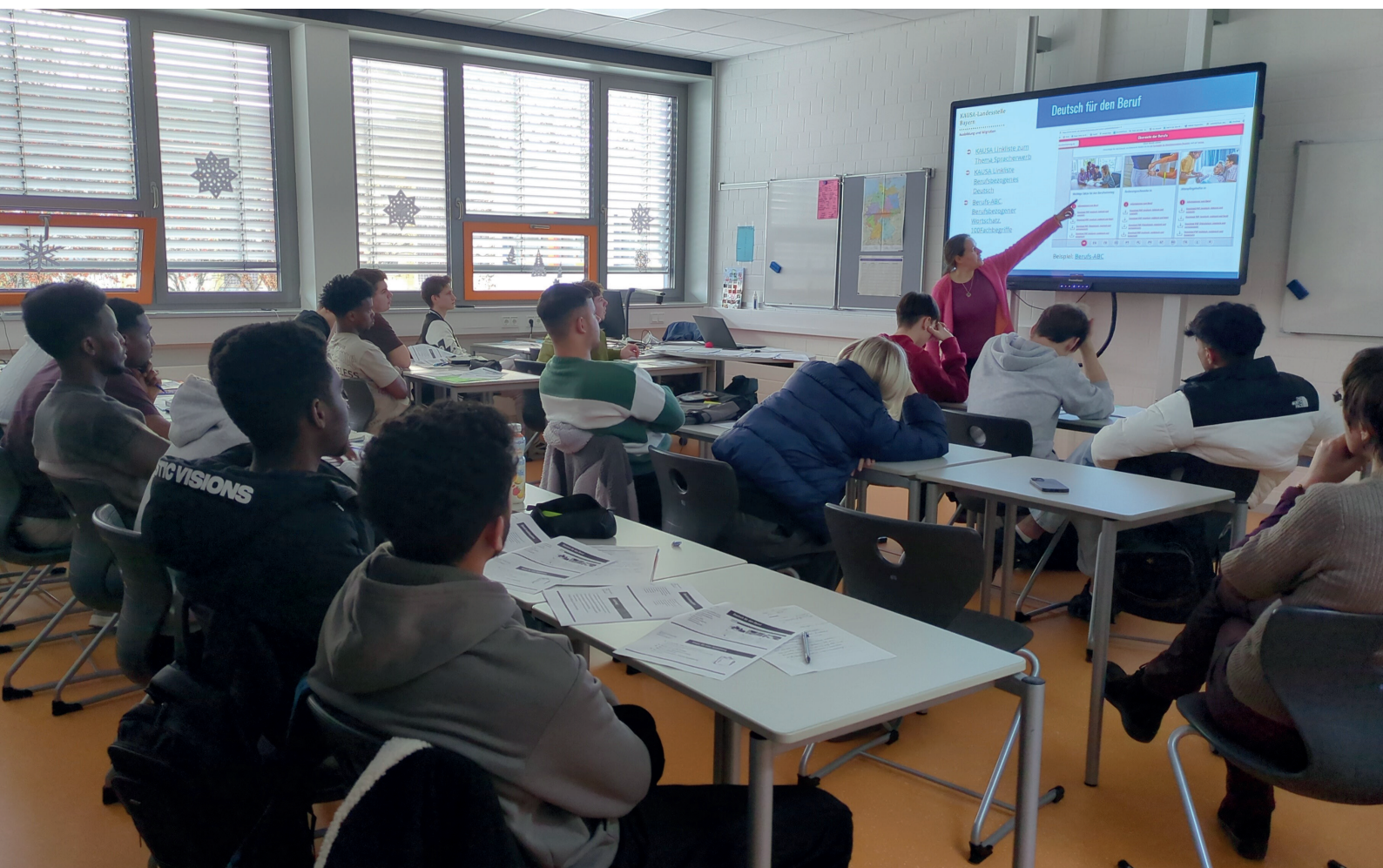
Eine Mitarbeiterin der KAUSA-Landesstelle Bayern erklärt das duale Ausbildungssystem den Schüler*innen einer Berufsintegrationsklasse (BIK) in einer Berufsschule.